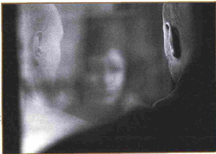
Tom Sandberg (Norvegia): Untitled ; 2009.